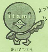
伊丹市マスコット たみまる